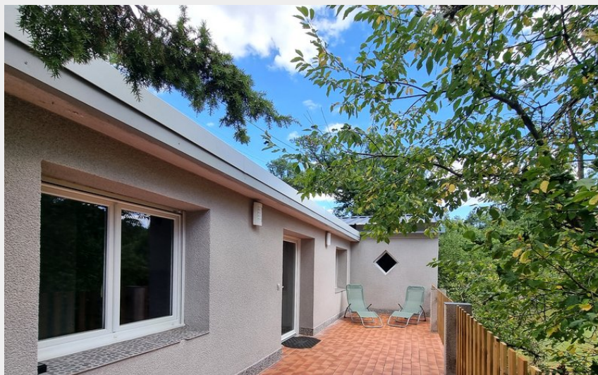
Crédit photo : Gîte du Pont de la Bloue_Bas-en-Basset (Haute-Loire Attractivité)