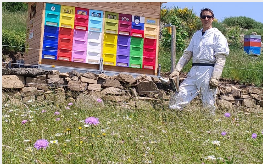
Crédit photo : Le rucher des neiges_Fay-sur-Lignon (Le rucher des neiges)