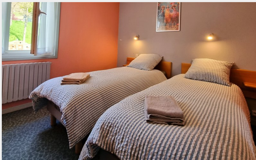
Crédit photo : Bîn Vendüd Châ Nous_Le Monastier-sur-Gazeille (Haute-Loire Attractivité)