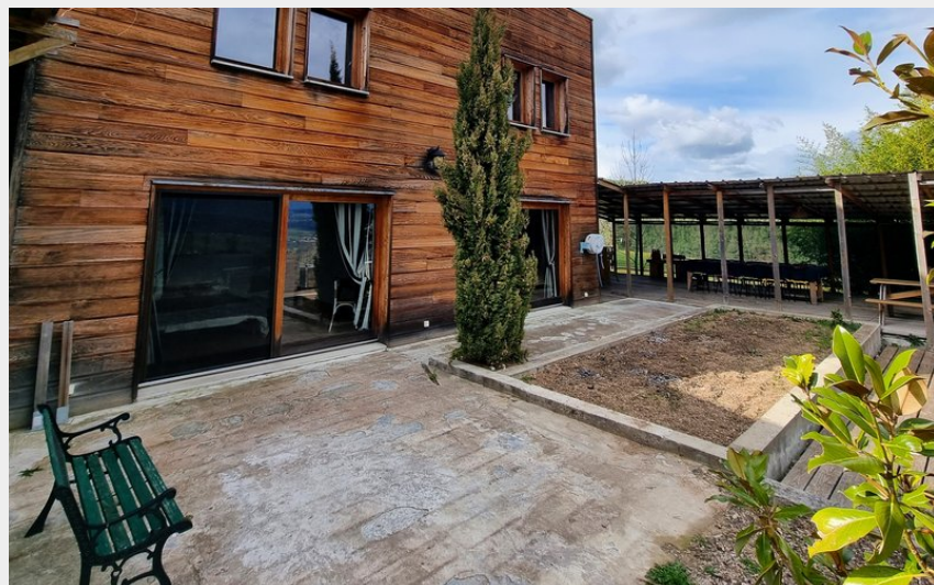
Crédit photo : Gîte de la vigne du Cuerq_Bas-en-Basset (Haute-Loire Attractivité)