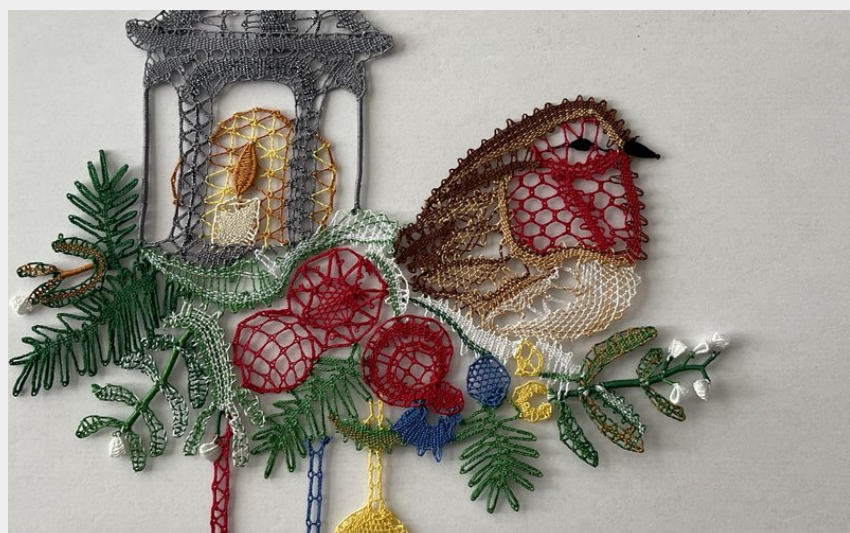
Crédit photo : Rouge gorge en dentelle au fuseau (iridat cedf le Puy)