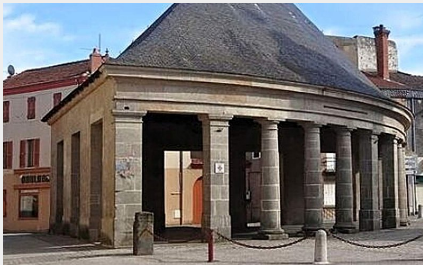
Village | Lempdes-sur-Allagnon