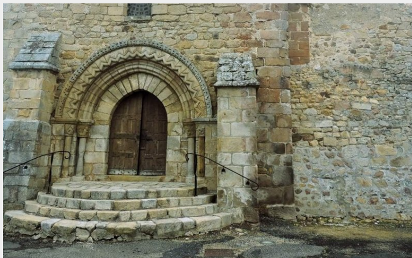
Crédit photo : Village | Chassignolles (Julien Au coeur des Pays d'Auvergne)