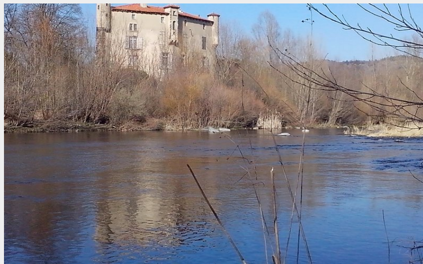
Le château de Volhac au bord de la Loire