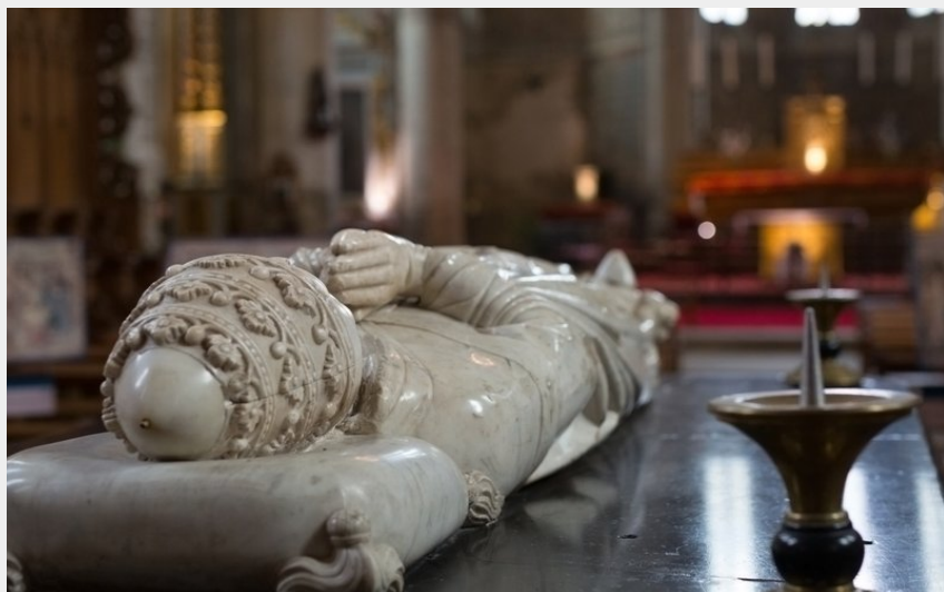
Crédit photo : Abbaye de La Chaise-Dieu_Abbatiale St-Robert_2019 (Laurence Barruel)