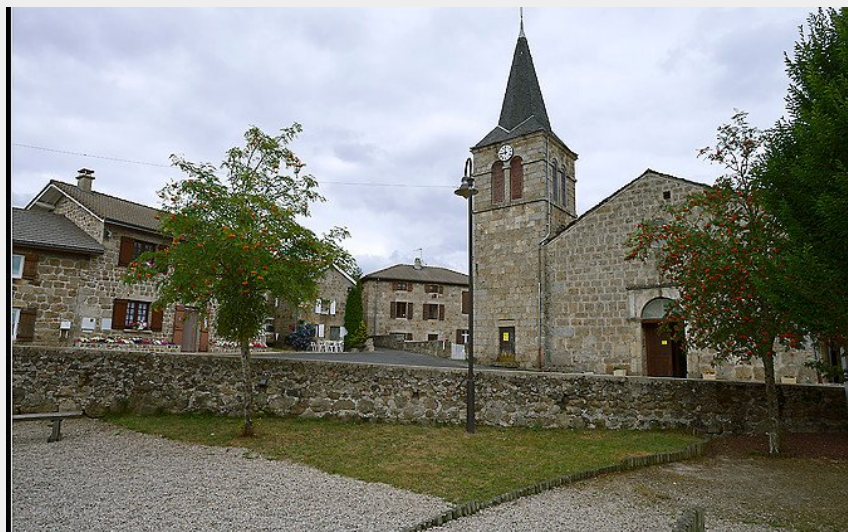
Eglise de Chenereilles