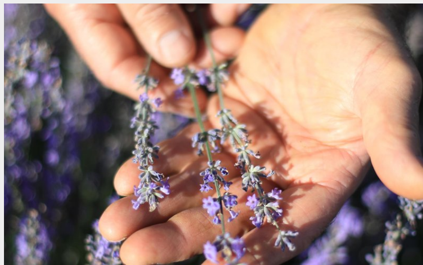
Crédit photo : Lavande cultivée et distillée en Auvergne (Distillerie Saint-Hilaire )