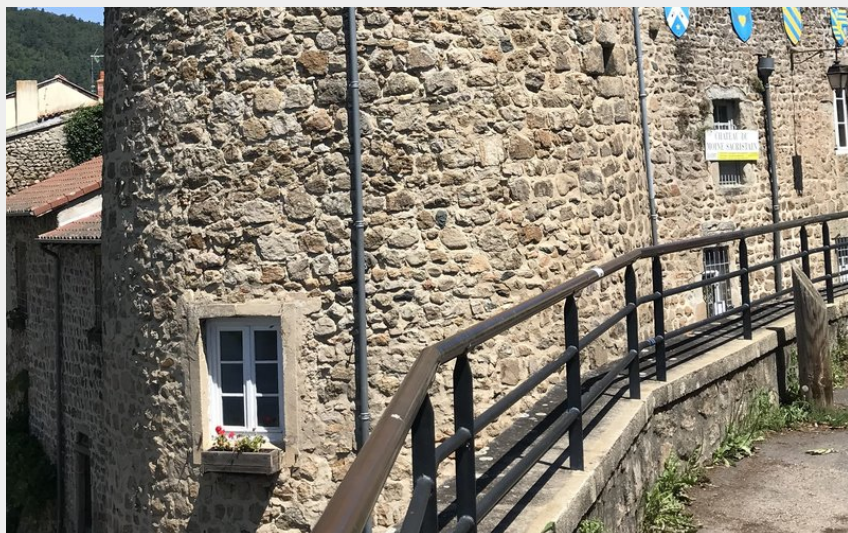
Tour des Bourguignons depuis la Place des Marronniers