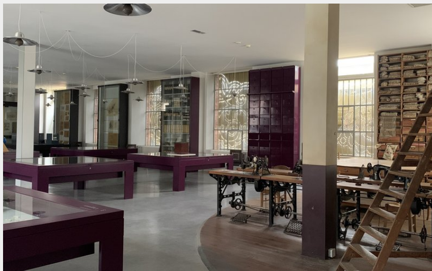
Crédit photo : Exposition dentelles (DR/Musée des Manufactures de Dentelles)