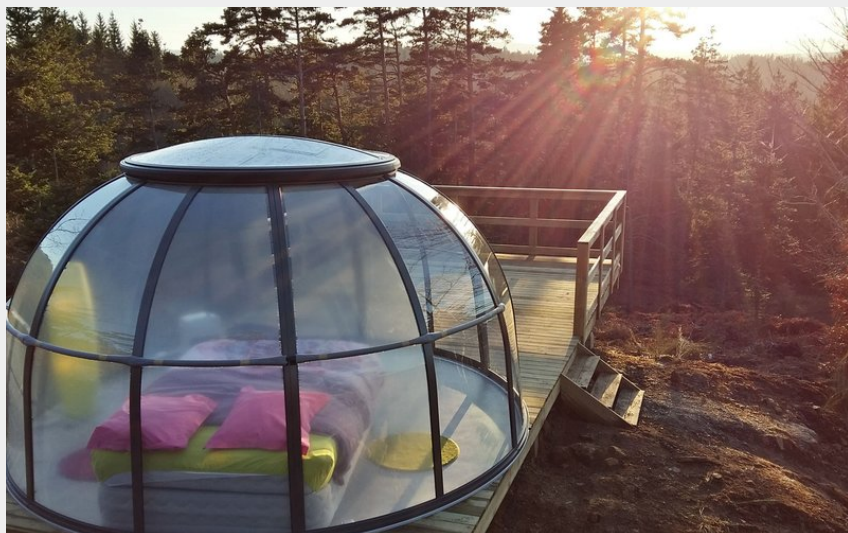
Crédit photo : Dôme Etoile Vue imprenable sur la forêt et les montagnes (DR/La_Roche_Aux_Fées)