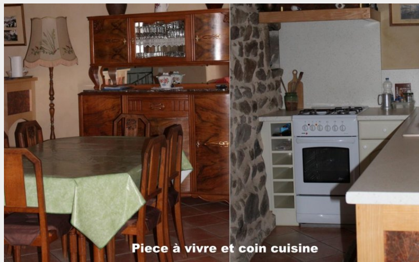
Piece à vivre et coin cuisine