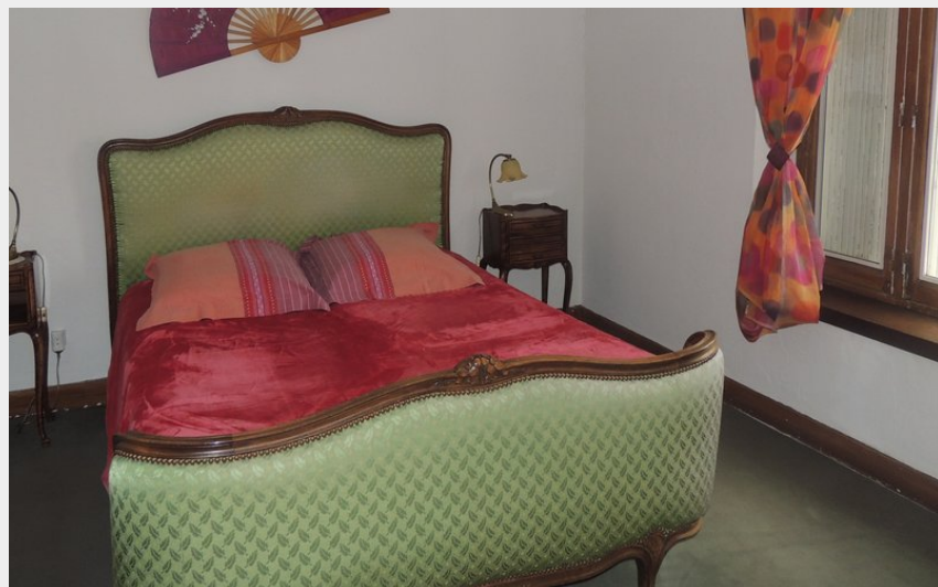
Crédit photo : La chambre double (MC Robert - Le Chant des Oiseaux)