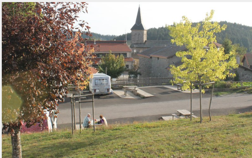
Crédit photo : aire de camping-car St Bonnet le Froid (aire de camping-car St Bonnet le Froid)