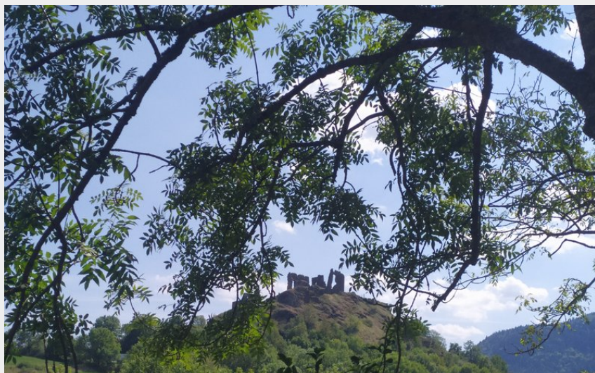
Crédit photo : Château d'Artias depuis le sentier d'accès (C.LE CORRE/CCDS)